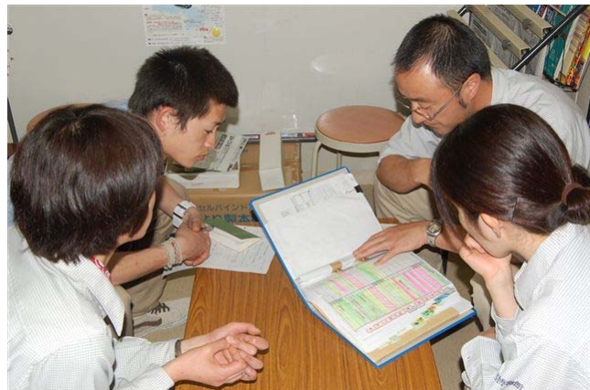
デスクワーク 自然解説員とはいっても野外での仕事ばかりではなく、ガイドの打ち合わせやイベントの企画などのデスクワークも意外とあります。スタッフ全員でのミーティングも行っています。