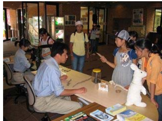
自然情報センターのカウンター業務 博物館内の自然情報センターと戦場ヶ原の入口にある赤沼自然情報センターの二箇所を管理しています。ここで自然情報やコースの情報等を提供しています。